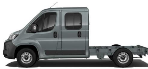
THUNDER GRAU P02B 350,00 (416,50)