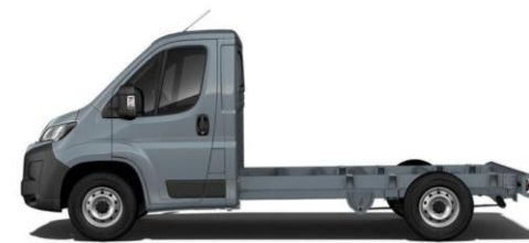
EISEN GRAU M0ZW 700,00 (833,00)