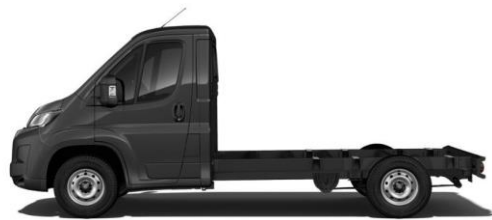
GRAPHIT GRAU M0E9 700,00 (833,00)