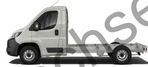
EXPEDITION GRAU P04K 350,00 (416,50)