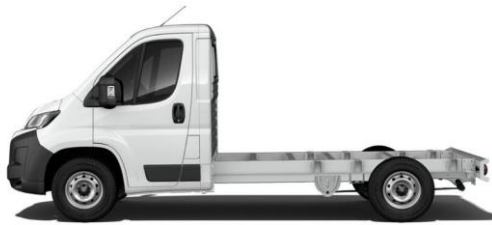
WEISS POPR 0,00 (0,00)