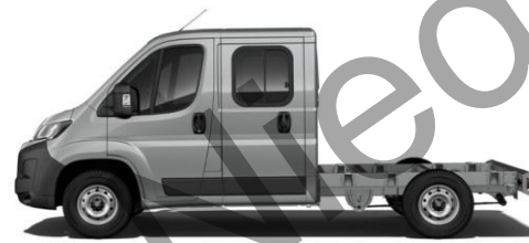
STAHL (ARTENSE) GRAU M0F4 700,00 (833,00)