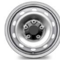
16-ZOLL-FELGEN ZIAS 0,00 (0,00)