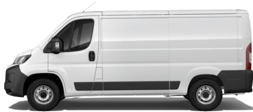
WEISS P0PR 0,00 (0,00)