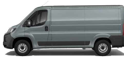
THUNDER GRAU P02B 350,00 (416,50)