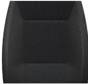
BTFX 0,00 (0,00)