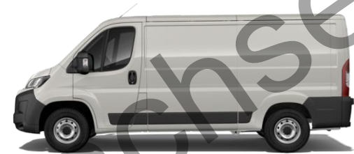
EXPEDITION GRAU P04K 350,00 (416,50)