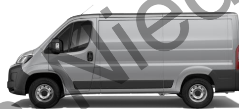
STAHL (ARTENSE) GRAU M0F4 700,00 (833,00)