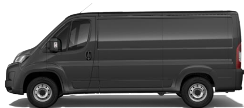
GRAPHIT GRAU M0E9 700,00 (833,00)