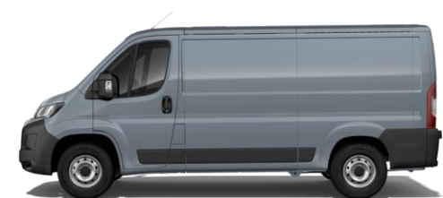
EISEN GRAU M0ZW 700,00 (833,00)