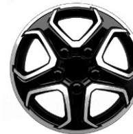
16-ZOLL-LEICHTMETALLFELGEN ZIBB 700,00 (833,00)