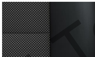
VINYL / KUNSTLEDER TJFZ 100,00 (119,00)