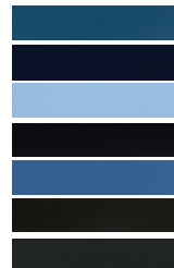
E03M Sturm Blau Metallic E04P Imperial Blau E05X Mundo Azur Blau E0CL Suggestivo Blau E0QD Fern Blau RAL 5023 E0EV UPS Braun E0VZ Schwarzgrau RAL 7021