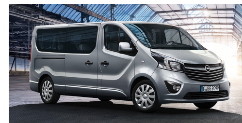
Stahlräder 6 J x 16 mit vollflächiger „10-Speichen“-Radabdeckung serienmäßig für Combi/Combi+.