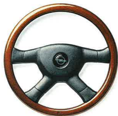
Vier-Speichen-Holzlenkrad , 17 45 504, Durchmesser: nur 37 cm, wertvolles Mahagoniholz mit Leder. Pralltopf (Adapter) zur Montage erforderlich, 17 45 541.

Damit Sie sich in Ihrem Vectra rundum wohl fühlen und genauso sicher wie entspannt unterwegs sind, können Sie seine anspruchsvolle Innenausstattung durch Zubehör-Artikel perfekt auf Ihre individuellen Bedürfnisse zuschneiden. Am besten fahren Sie dabei, wenn Sie Original-Zubehör von Opel wählen. Das paßt haargenau und zeichnet sich durch ansprechende Ästhetik und hohe Funktionalität aus.