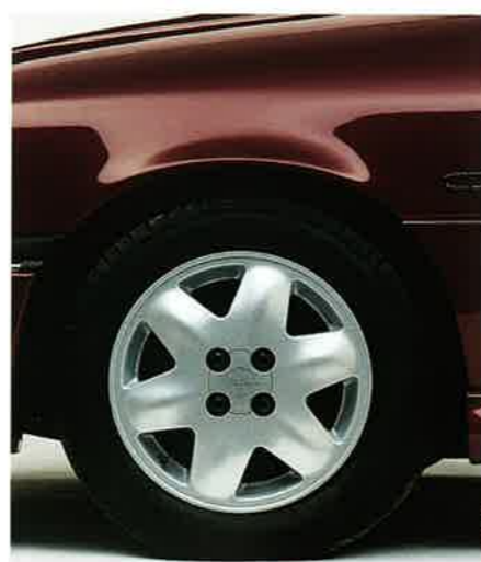
Leichtmetallrad, 17 50 313, 5 1/2 J x 14, mit ABE. Farbe: Silber, Zierkappe für Radnabe und Abdeckkappen für Radschrauben.