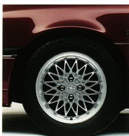
Leichtmetallrad, 17 50 322, 6 J x 15, mit ABE. Farbe: Titan, Zierkappe für Radnabe und Abdeckkappen für Radschrauben.

Hier sehen Sie das vielseitige Programm für den individuellen Auftritt Ihres Vectra: Opel Leichtmetallräder. Die Varianten zeigen eine breite Palette vom sportlichen bis zum eleganten Leichtmetallrad. Ästhetische Highlights, ganz nach Ihrem Geschmack. Jedes einzelne Rad wurde unter härtesten Testbedingungen entwickelt und bietet somit ein Optimum an Sicherheit und Qualität.