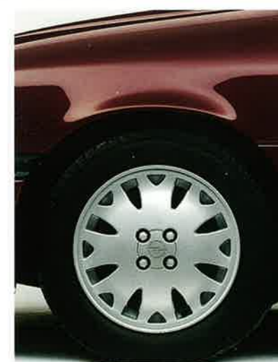
Leichtmetallrad, 17 50 327, 6 J x 15, mit ABE. Farbe: Silber, Zierkappe für Radnabe.