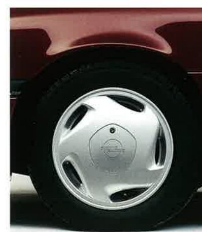
Leichtmetallrad, 17 50 346, 5 1/2 J x 14, mit ABE. Farbe: silber lackiert, Zierkappe für Radnabe.