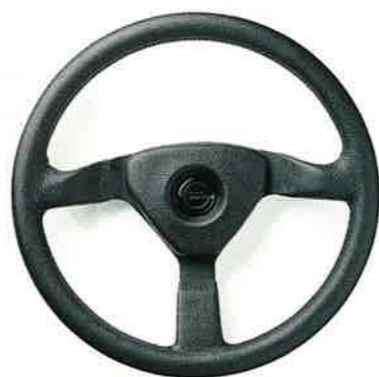
Drei-Speichen-Lederlenkrad , 17 45 508, hochwertiger, besonders griffiger Echtlederbezug. Zur Montage ist der Pralltopf (Adapter), 17 45 541, erforderlich.

Die Telefonkonsole , 17 88 086, integriert sich harmonisch in das Interieur des Vectra. Die griffgerechte Platzierung sowie blendfreie Ablesbarkeit des Telefon-Displays garantieren optimale Sicherheit und ergonomischen Komfort. In ledergearbter Kunststoffausführung. Schnelle, problemlose Montage.