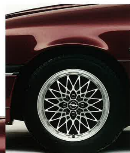
Leichtmetallrad, 17 50 321, 6 J x 15, mit ABE, radfrontkopiert. Farbe: Schwarz, Zierkappe für Radnabe und Abdeckkappen für Radschrauben.