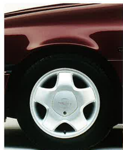
Leichtmetallrad, 17 50 326, 5 1/2 J x 14, mit ABE. Farbe: Silber, Zierkappe für Radnabe und Abdeckkappen für Radschrauben.