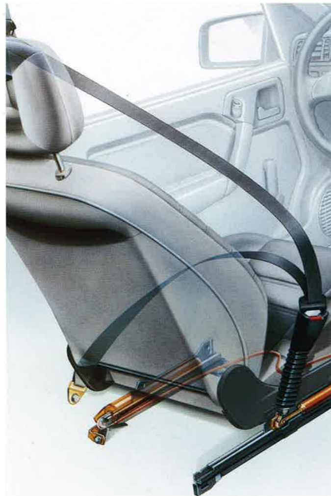
Höhenverstellbare Sicherheitsgurte vorn und hinten. Blitzschnelles Straffen der Gurte schon bei einer Unfallschwere, die einem Mauerprall von 20 km/h entspricht.

Das Rundumschutz-System für verbesserten Insassenschutz besteht aus einer Kombination