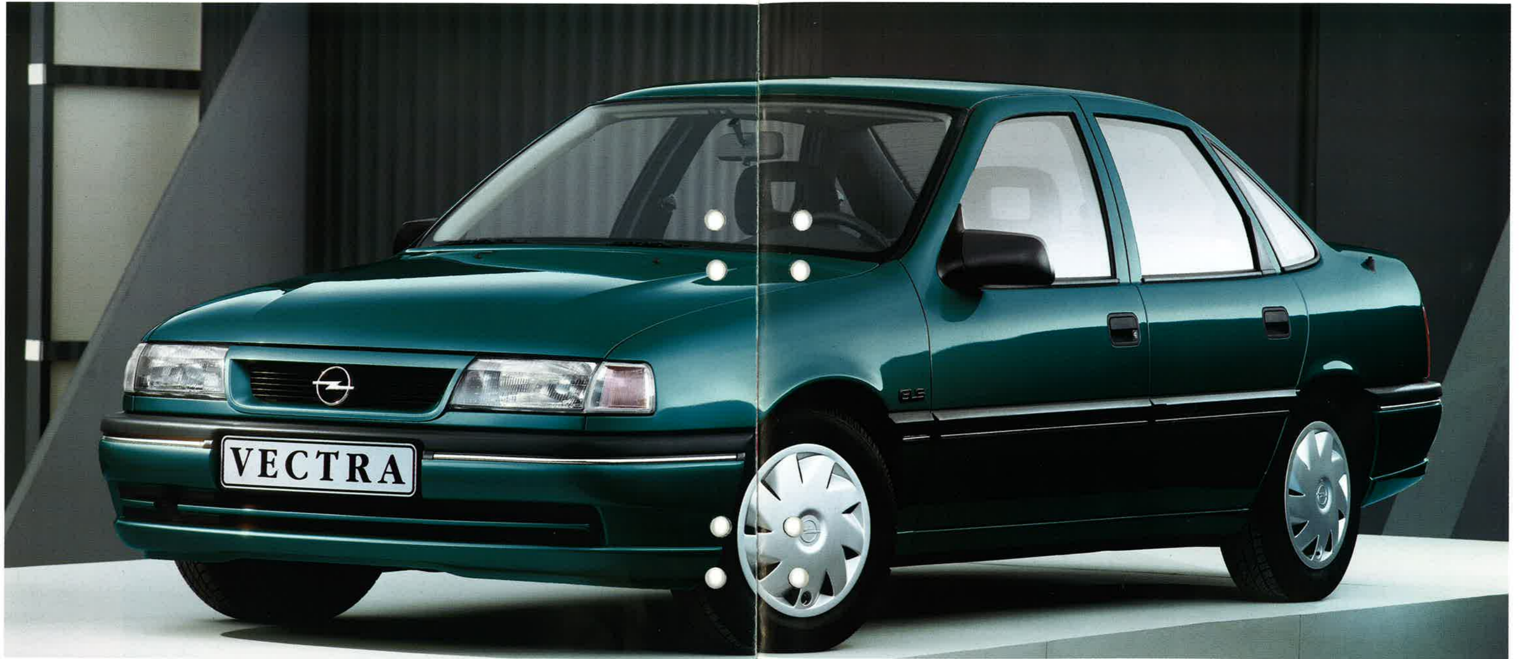
Der Vectra GLS.

Der Vectra GL eröffnet Ihnen den Einstieg in die Vectra-Klasse. Zahlreiche funktionelle Detailverbesserungen sowie die hochwertige Ausstattung sorgen für sinnvollen Komfort.