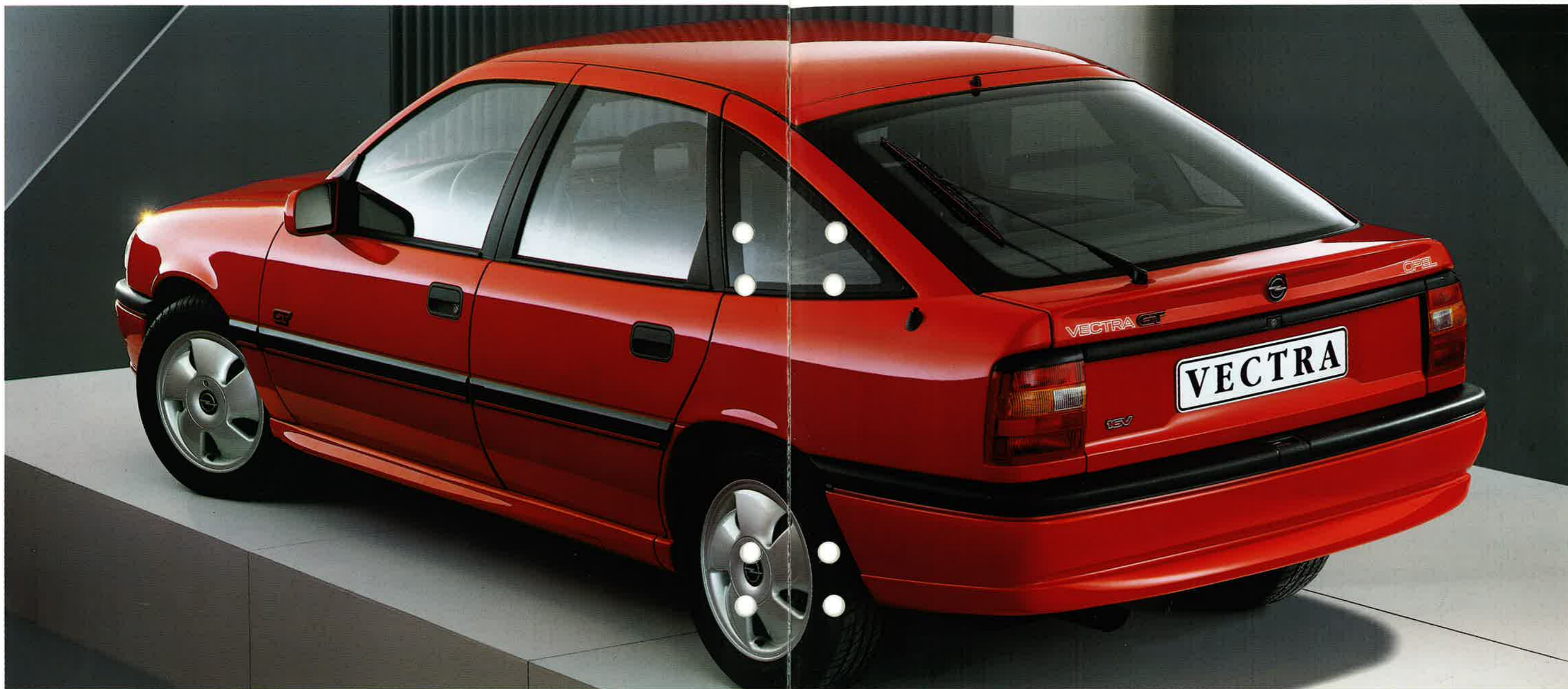
Der Vectra GT 16V.

Erleben Sie Fahrfreude und Fahrsicherheit in idealer Kombination. Das straff abgestimmte Fahrwerk mit Gasdruckstoßdämpfern, Scheibenbremsen vorn und hinten, vorn innenbelüftet, ein 5-Gang-Sportgetriebe und besonders der 16V-Motor sorgen für das richtige