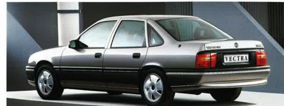
Der Vectra V6. Diskretes Under- statement, aufregende Technik und kom- plette Ausstattung.

Klasse. Laufkultur vom Feinsten und ausgestattet mit Electronic Traction Control (ETC), die eine hohe Fahr-sicherheit gewährt. Selbstverständlich hat er einen Opel Full Size Airbag serienmäßig.