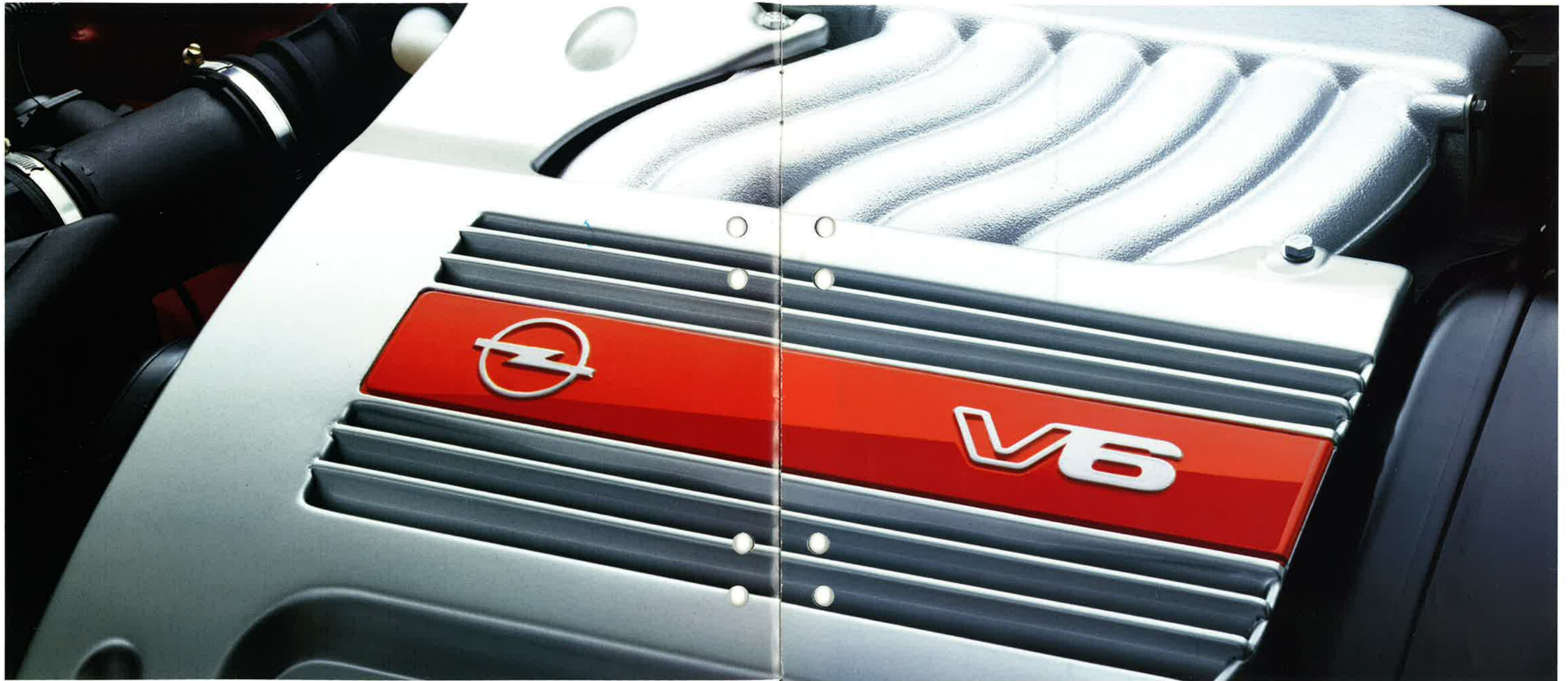
Das Triebwerk des Vectra V6. 24 Ventile, 2,5 Liter, 125 kW (170 PS).

DER NEUE VECTRA V6. 6 ZYLINDER, 24 VENTILE. HIGH-TECH IN KOMPAKTER BESTFORM.