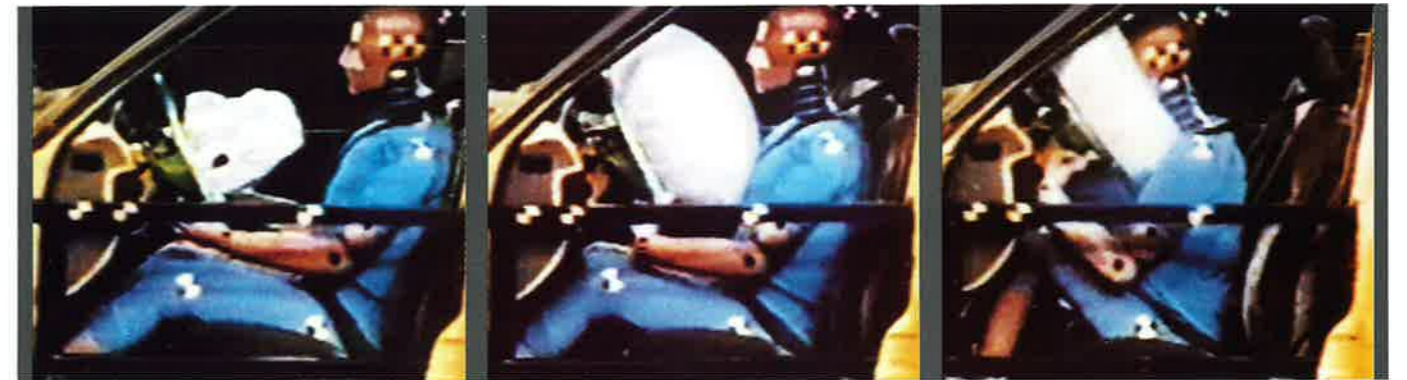
Der Opel Full Size Airbag. Bei einem Aufprall in 50 Millisekunden voll aufgeblasen.