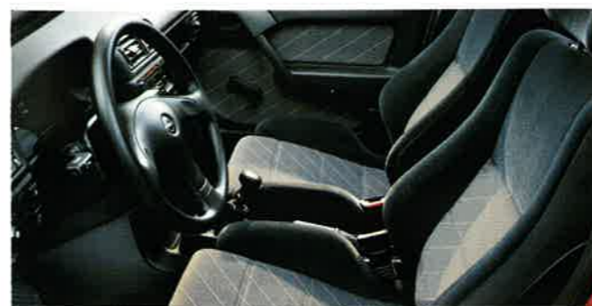
Der Vectra GT. Sportsitze mit Seitenführung für perfekten Halt. Drei-Speichen-Sportlenkrad.

Außentemperatur und Reichweite des verfügbaren Kraftstoffes. Das Check Control System informiert Sie über alle wichtigen Funktionen des Vectra 16V. Außer dem Vectra GT 16V mit 2.0i-16V-Motor, 110 kW (150 PS), gibt es den sportlichen Vectra GT mit 2.0i-Motor mit 85 kW (115 PS). Beide Modelle sind als Fließheck und Stufenheck erhältlich.