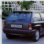
Mit dem neuen Grill, den Leichtmetallrädern und dem Heckspoiler in Wagenfarbe hat der Corsa GSi rundum gewonnen.