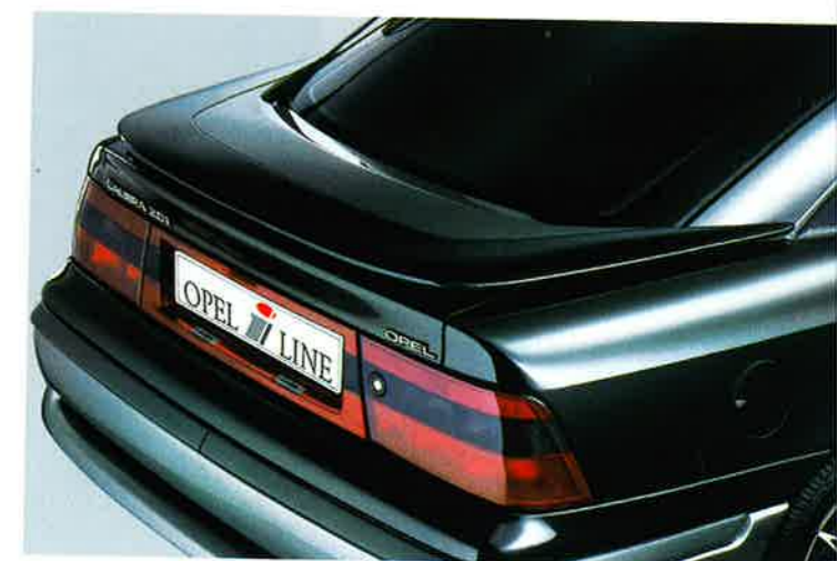
Markant und dynamisch: Heckflügel i 27 01 449 und rot/schwarze Heckblende i 27 17 001.