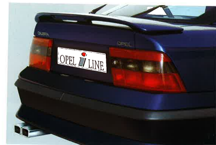
Individuell und elegant Heckflügel i 27 01 401

Zur Gewährleistung der hohen Ansprü- che an Produktqualität und Verarbeitung setzt die Irmscher Firmengruppe ein ausgefeiltes Qualitätsmanagement-System ein. Mit der Verleihung des ISO 9001- Zertifikates durch die DEKRA wurde dessen Wirksamkeit bescheinigt.