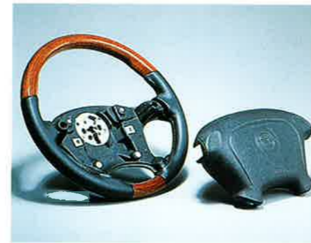
Noblesse: Lenkradkranz Holz/Leder i 71 18 014.

Der OPEL i LINE Lenkradkranz in Holz/Leder für das serienmäßige Airbag-Lenkrad kombiniert mit Wurzelholz-Ascherdeckel, -Armaturentafeln und -Schalthebelknopf schafft ein luxuriöses Ambiente im Fahrzeuginnern.