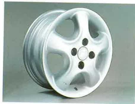
Leichtmetallräder im Softstern-Design und im Twin Spoke-Design harmonisieren hervorragend mit der Karosserielinie des Sportcoupés...