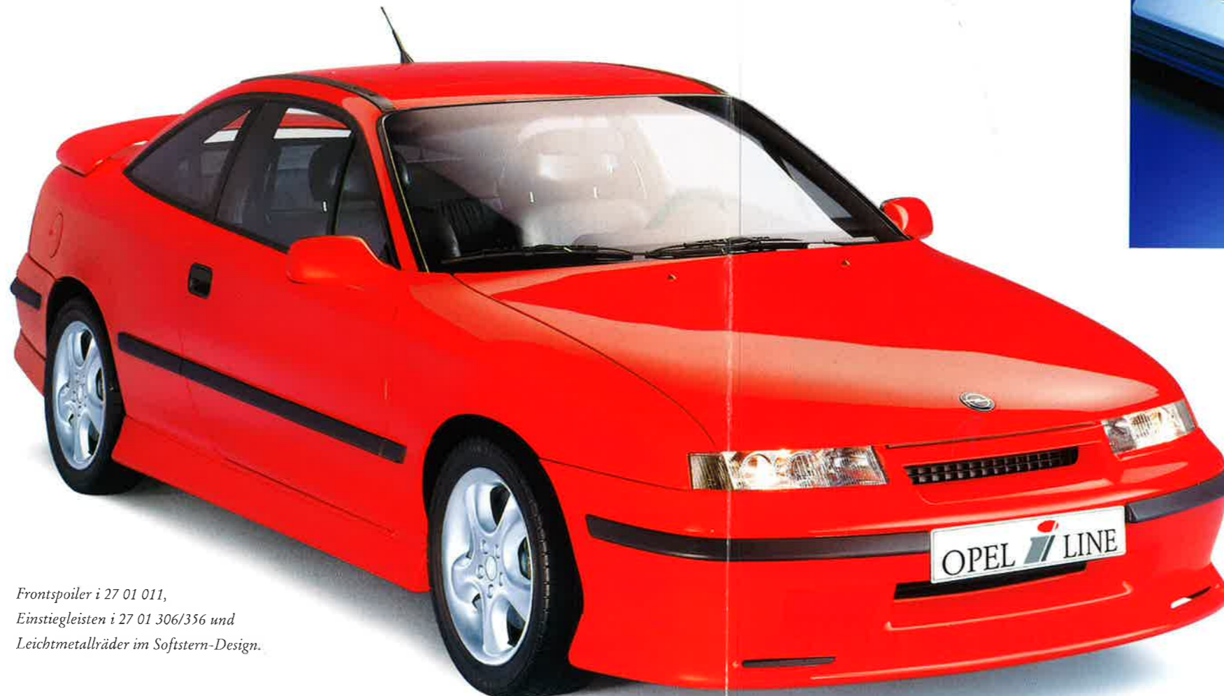
Frontspoiler i 27 01 011, Einstiegleisten i 27 01 306/356 und Leichtmetallräder im Softstern-Design.

Geradezu prädestiniert ist der Opel Calibra für die exklusiven Leichtmetallräder in den Größen 5 1/2 x 14 bis 7 1/2 x 17 Zoll im eleganten Softstern- oder im sportiven Twin Spoke-Design. Sie stellen die optimale Ergänzung zum OPEL i LINE Komplettfahrzeugwerk dar und sorgen für gesteigerte Sicherheit in Kurven, beim Bremsen