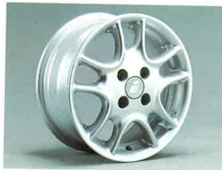
... und stehen in den Größen von 5 1/2 x 14 bis 7 1/2 x 17 zur Verfügung.