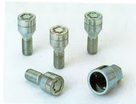
Mit dem OPEL i LINE Radsicherungs-System i 61 10 118 schützen Sie Ihre hochwertigen Leichtmetallräder wirkungsvoll gegen Diebstahl.