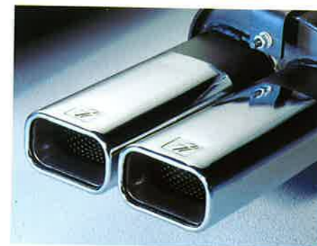
Der optische Akzent am Calibra-Heck: OPEL i LINE Nachschalldämpfer mit rechteckigem Doppel-Endrohr.

Der Nachschalldämpfer mit verchromtem rechteckigem Doppel- Endrohr verbessert die Leistung durch Minimierung des Staudruckes. Extrem langlebig durch hochwertigen Materialien setzt er optisch den entsprechenden Akzent am Heck des Fahrzeuges.