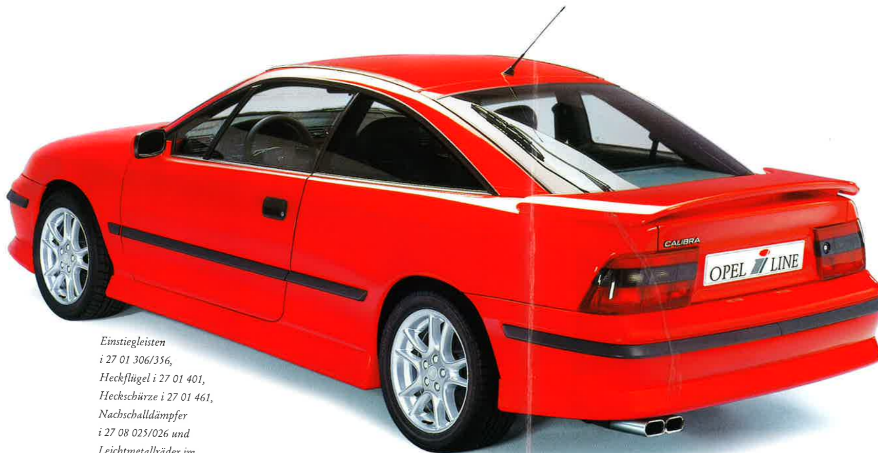
Einstiegleisten i 27 01 306/356, Heckflügel i 27 01 401, Heckschürze i 27 01 461, Nachschalldämpfer i 27 08 025/026 und Leichtmetallräder im Twin Spoke-Design.

OPEL i LINE Fahrwerkteile wurden in aufwendigen Tests individuell auf jedes Fahrzeug abgestimmt und bieten dadurch ein Höchstmaß an Fahrkomfort.