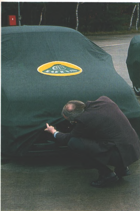
Enthüllt wurden die ersten Lotus Omega, die Besitzer konnten die Sportlimousinen auf dem Opel-Testgelände kennenlernen (Seite 20)