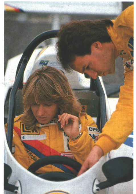
Entfaltet hat Steffi Graf im Rennwagen ganz neue Fähigkeiten, wie ihr sogar Profis bestätigten (Seite 84)