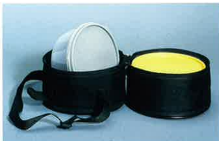
Hundefutter-Set. Bestehend aus Futter- und Trinkschale in Nylontasche mit Reißverschluss.

für die Suche nach einzelnen Zubehörteilen aufzuwenden. Die Pakete enthalten außerdem zum Teil Artikel, die separat nicht erhältlich sind. Die Opel Ingenieure haben bei der Konstruktion des Meriva den besten Freund des Menschen natürlich nicht vergessen. Die passgenau gefertigte Hundedecke hält Ihren Hund warm und die Innenausstattung Ihres Meriva sauber und trocken.