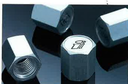
Ventilkappen aus Aluminium (Satz mit 4 Kappen).