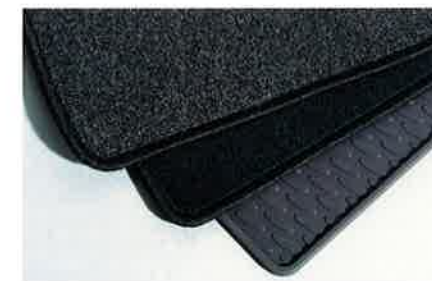
An den Fußraum speziell angepasste Autoteppiche mit verbesserter Befestigung.