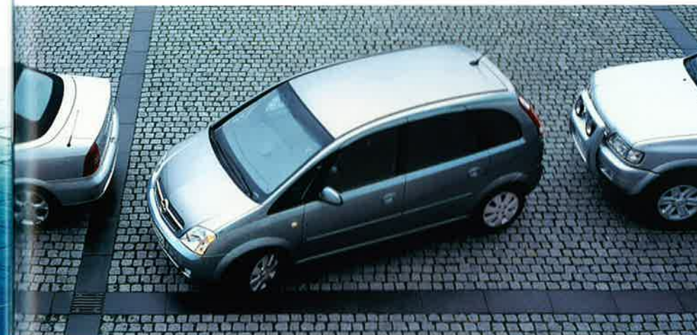
Der Parksensord warnt den Fahrer mit einem akustischen Signal vor Hindernissen hinter dem Fahrzeug.