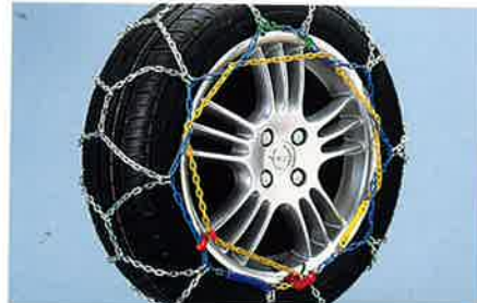
Schneeketten aus hochwertigem Stahl mit farbcodierten Teilen zur schnellen Montage.