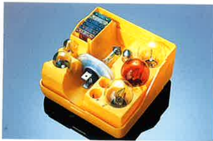
Glühlampenset mit allen wichtigen Glühlampen und Sicherungen, übersichtlich und sicher aufbewahrt in einer Kunststoffbox.