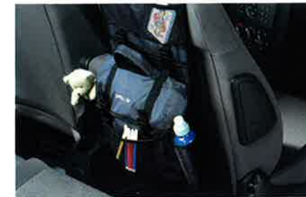
Abnehmbarer Rucksack mit zahlreichen Fächern. Befestigung an der Rückenlehne des Vordersitzes, unterwegs als zusätzliche Ablage zu verwenden.