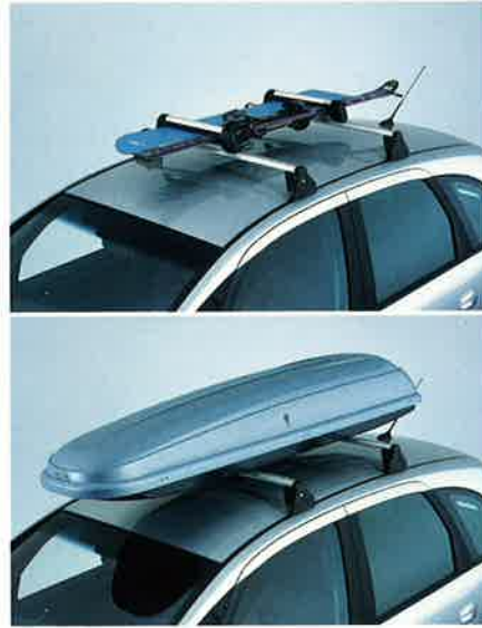
Mit dem Alpin Set des Meriva haben Sie die Wahl zwischen einer aerodynamisch geformten Sport Box für den sicheren Transport Ihrer kompletten Winterausrüstung oder einem Skiträger für den Transport von vier Paar Ski oder einem Snowboard und einem Paar Ski.

trägern – je nach der von Ihnen bevorzugten Wintersportart. Jedes Alpin Paket enthält außerdem eine weiche, wasserundurchlässige Laderaummatte, einen Satz Schneeketten und ein Thermo-Set mit einer schwarzen Nylontasche, in der sich eine Thermoskanne und zwei Becher befinden. Die Becher passen genau in die Getränkehalter des Meriva, und der Wintersport macht noch mehr Spaß, wenn man sich mit einem heißen Kakao oder Kaffee wieder aufwärmen kann.