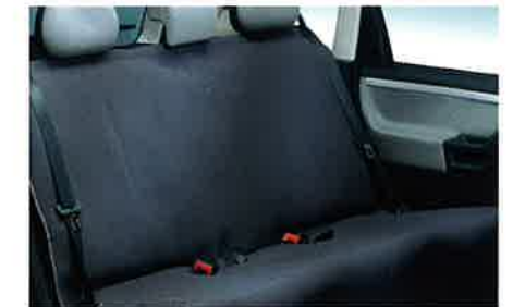
Schondecke für die Rücksitze zur Schnellbefestigung an den hinteren Kopfstützen zum Schutz der Rücksitze beim Transport größerer Gegenstände.