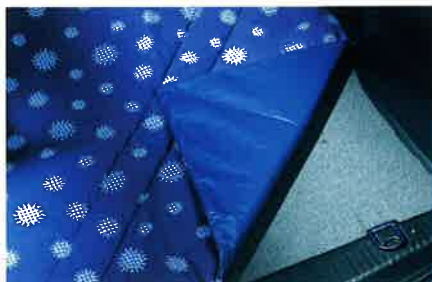
Washbare Hundedecke für den komfortablen und warmen Transport Ihres Hundes. Hält den Innenraum Ihres Meriva frei von Hundehaaren.