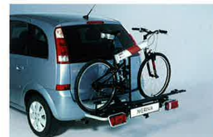
Heckfahrradträger zur Montage an der Anhängerzugvorrichtung, mit spezieller Schnellmontagevorrichtung und Erweiterungsmöglichkeit für ein drittes Fahrrad.