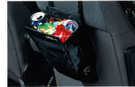
Abfallbehälter für Sauberkeit unterwegs, mit 50 Kunststoffbeutel. Befestigung an der Rückenlehne des Vordersitzes.