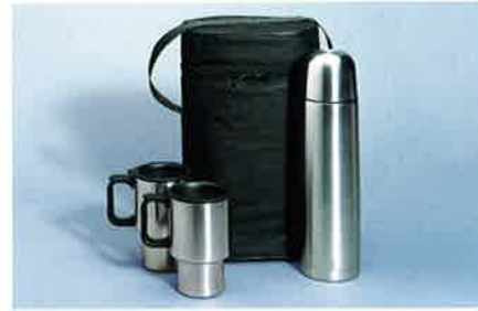
Thermo-Set in schwarzer Nylontasche, besteht aus einer Thermoskanne aus hochwertigem Edelstahl und zwei Edelstahlbechern, die genau in die Getränkehalter des Meriva passen.