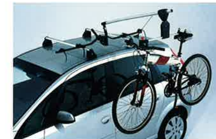
Aluminium-Fahrradträger mit servounterstütztem Liftsystem, zum mühelosen Heben und Senken des Fahrrads (max. 2 Träger).