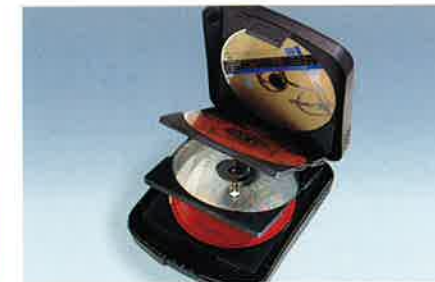
CD-Aufbewahrungsbox für max. 12 CDs. Leicht zu transportierendes, kompaktes Hartkunststoffgehäuse mit erhöhtem Schutzfaktor.