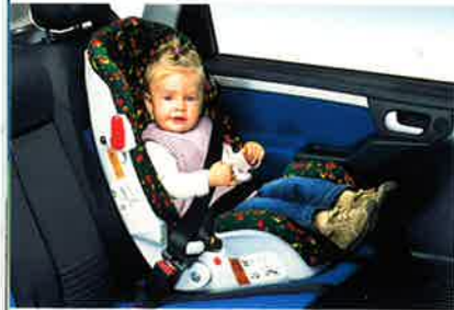
Kindersitz für den Transport von Kindern von 9 bis 25 kg. Nur auf dem Rücksitz zu verwenden. Für Kinder von 9 bis 18 kg in Verbindung mit einem separaten Sicherheitstisch verwenden.