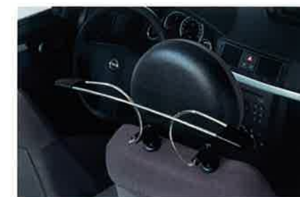
Ideale Lösung für den knitterfreien Transport von Jacken und Mänteln. Bei Fahrzeugen ohne aktive Kopfstützen kann der Kleiderbügel auf der Fahrer- oder Beifahrerseite angebracht und genutzt werden, solange jeweils der Sitz dahinter nicht besetzt ist. Bei Fahrzeugen mit aktiven Kopfstützen darf der Kleiderbügel nur auf der Beifahrerseite angebracht werden. Es dürfen in diesem Fall weder der Beifahrersitz noch der Sitz dahinter besetzt sein.

Auch die Passagiere auf den hinteren Sitzen werden am neuen Meriva ihre Freude haben, können sie doch nach Belieben ihr eigenes musikalisches Radio- und Musikprogramm hören.