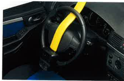
Lenkradsperre mit Airbag-Sicherheitsfunktion, zur wirksamen Abschreckung von Autodieben.