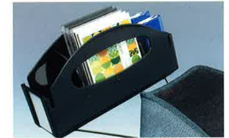
Die Ablagebox bietet zusätzlichen Stauraum. Wird unter dem Teppich auf der Beifahrerseite befestigt.