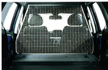
Flexibles Schutzgitter. Passt genau hinter die Vordersitze, schützt Ihre vierbeinigen Mitreisenden und hält sie davon ab, auf die Vordersitze zu springen.