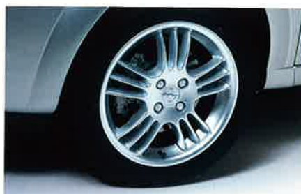
14" Spectra-Line-Leichtmetallräder. Auch als 16"-Felgen.