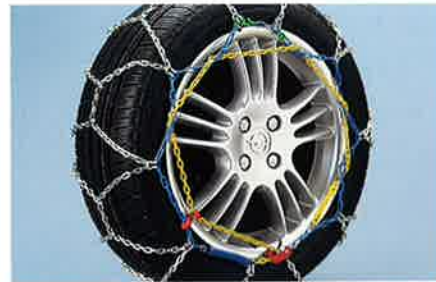
Schneeketten aus qualitativ hochwertigem Stahl, mit farbcodierten Teilen für die schnelle Montage.