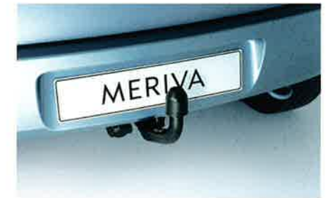
Anhängerzugvorrichtung mit abnehmbarem Kugelkopf. Zuglast max. 1200 kg. Für bessere Sicht nach hinten bitte separaten asphärischen Außenspiegel bestellen.