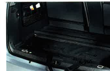
Vierteiliges Meriva Reisetaschen-Set aus wasser- und staubabweisendem Nylon. Damit transportieren Sie im Meriva ein Maximum an Reisegepäck auf kleinstem Raum. Die Taschen passen genau auf ihren vorbestimmten Platz – die Schultertasche unter den Beifahrersitz, eine weitere Tasche für Freizeitkleidung unter dem Gepäckraumboden, und zwei weitere Taschen passen sich genau an die Konturen der Gepäckraumseitenwände an.