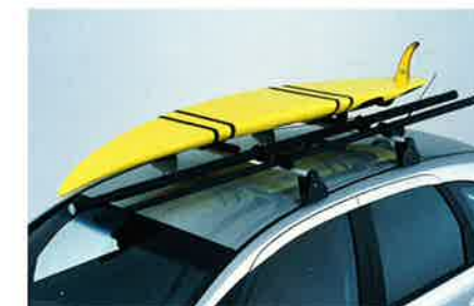
Surfboardträger mit Mosthalterung und Schnellverschluss.