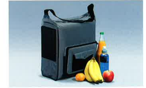
Die 12 l Kühltasche hat eine Kühlleistung bis ca. 20 °C unterhalb der Umgebungstemperatur im Fahrzeug. Mit separatem Batteriewächter und Netzgerät.