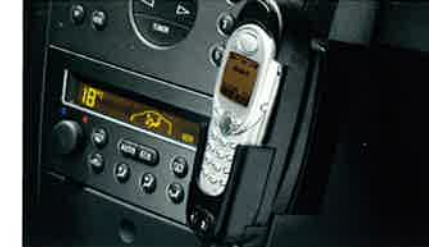
Fahrzeugspezifische Telefonkonsole, Halterung und Freisprecheinrichtung (erhältlich für alle gängigen Telefon-Modelle von Nokia, Siemens, Ericsson, Motorola, Alcatel) für eine sichere und komfortable Kommunikation.