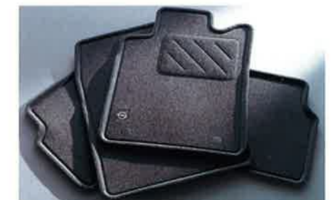
Opels neue, formangepasste 3-D-Fußmatten mit extra hohem Rand für vorn und hinten und verbesserter Befestigung.