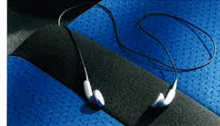
Für das eigene Musikprogramm der leichtgewichtige Stereo-Kopfhörer mit Ohrsteckern für das Twin Audio® von Opel.