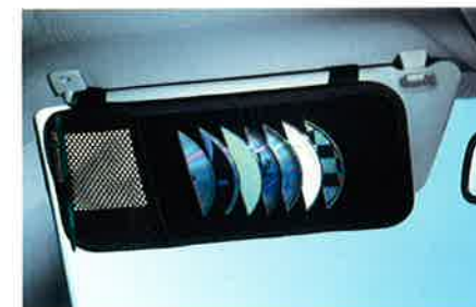
CD-Halter zur Befestigung an der Sonnenblende mit schonenden, weichen Taschen für die Aufbewahrung von max. 12 CDs oder anderen kleineren Utensilien.

kann aber bei Bedarf auch Getränke wie Kaffee oder Tee heiß halten. Sie hören unterwegs gerne Musik? Ihre 12 Lieblings-CDs lassen sich bequem im Sonnenblendenfach unterbringen. Und die vielfältigen Ablagemöglichkeiten in Ihrem Meriva sorgen dafür, dass Sie jederzeit alles in Griffweite haben, was Sie brauchen.