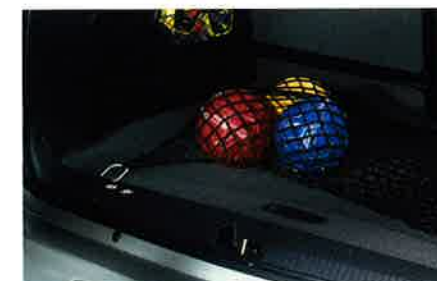
Gepäcknetz zum Sichern sperriger Gegenstände im Laderaum. Schützt Zuladung und Fahrzeug.