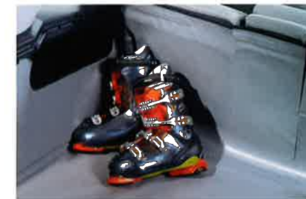
Flexible Laderaummatte, robust und leicht zu reinigen.