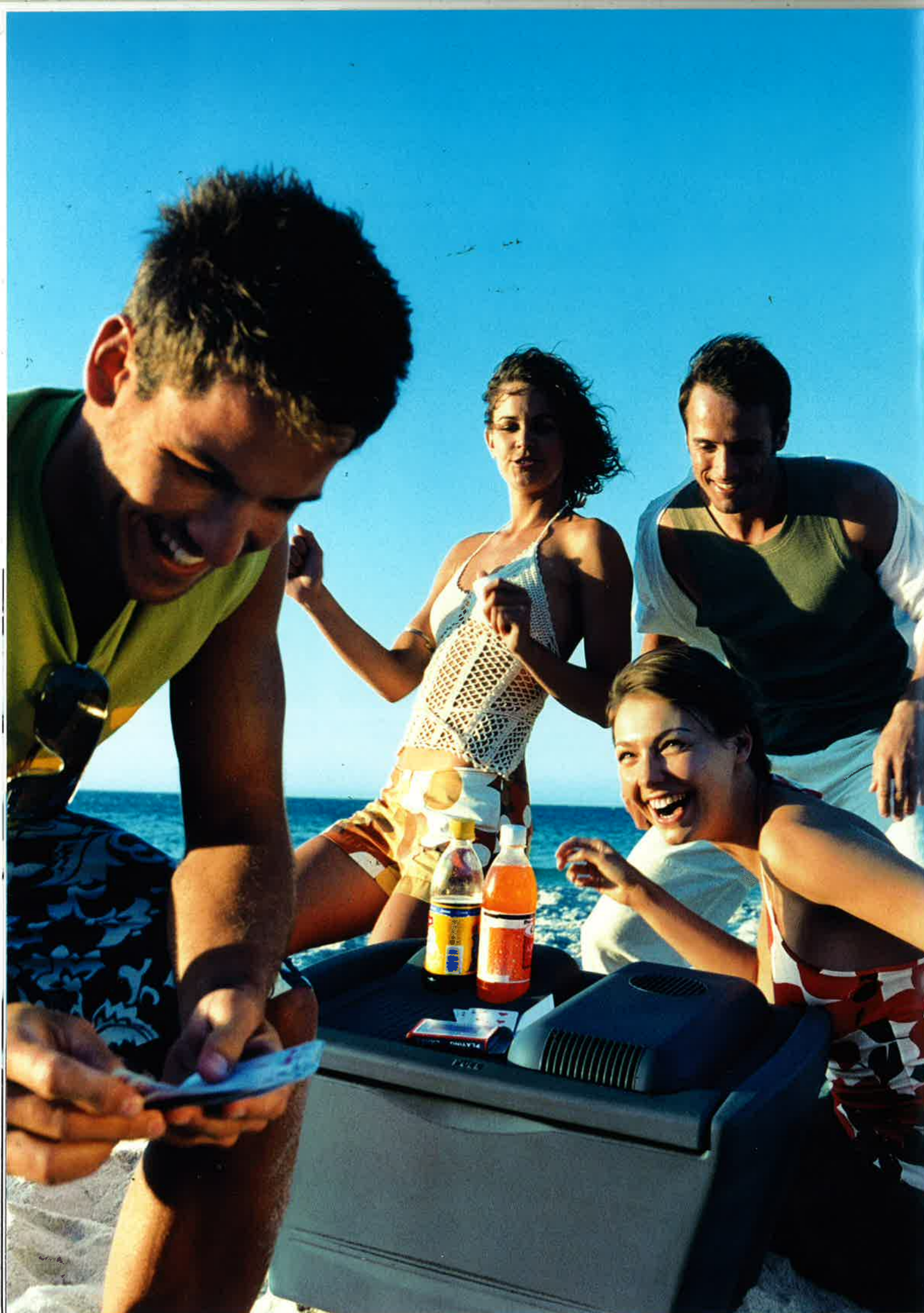
Die 32 Liter Kühlbox hält ihren Inhalt kalt oder warm – wie Sie es wünschen. Mit integriertem Batteriewächter, der eine Entladung der Fahrzeugbatterie verhindert.

Carpe diem – in unserer schnelllebigen Zeit ist es beruhigend zu wissen, dass Ihnen Ihr Meriva die Möglichkeit gibt, Ihre persönliche Fahrerumgebung mit individuellem Zubehör ganz nach Ihrem eigenen Geschmack zu gestalten.