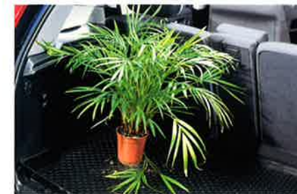
Laderaumschale aus haltbarem rutschfestem Kunststoff. Verhindert das Verrutschen der Zuladung während der Fahrt.