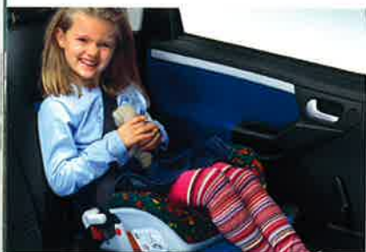
Sitzschale für Kinder von 22 bis 36 kg, für Rücksitz. Erhöht die Sitzposition Ihres Kindes so weit, dass der Sicherheitsgurt seine optimale Schutzwirkung entfalten kann.