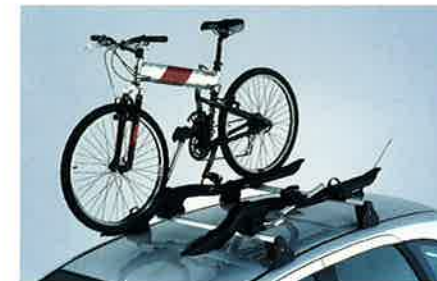
Premium Fahrradträger, hält das Fahrrad in Position, so dass Sie beide Hände zum Befestigen frei haben (max. 2 Träger).