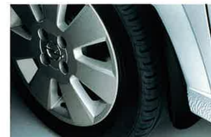
Schmutzfänger vorn und/oder hinten, schützt den Lack vor Steinen und Schmutz.