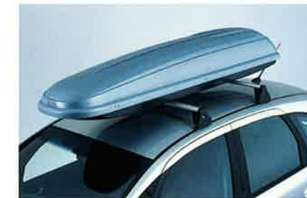
Sport Box (225 x 55 x 38 cm), 310 l Fassungsvermögen, abschließbar, staub- und wasserdicht. Lackierbar in Karosseriefarbe.