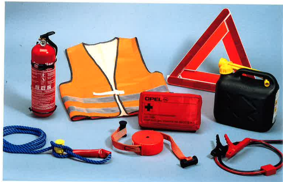
Opels Sicherheitszubehör kann Notfallsituationen schnell entschärfen: Warndreieck, 5- oder 10-l-Kraftstoffkanister mit Einfüllstutzen, Starthilfekabel für Benzin- oder Dieselmotoren, Abschleppseil oder Abschleppgurt, auf Wunsch auch Abschleppstange.

Die Zuverlässigkeit Ihres Meriva könnte für andere Fahrzeuge, die abgeschleppt werden müssen oder deren Batterien leer sind, „lebensrettend“ sein.