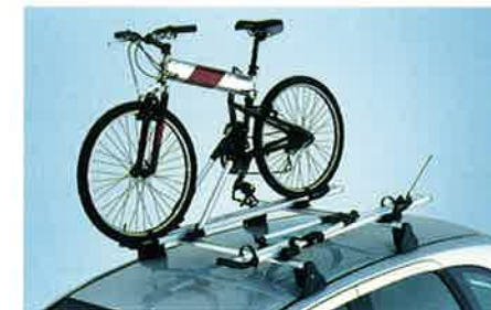
Basisträger mit zwei Fahrradträgern aus stabilem, aber leichtem Aluminium.