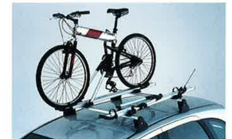
Aluminium-Fahrradträger aus strapazierfähigem, leichtgewichtigen Aluminium (max. 4 Träger).