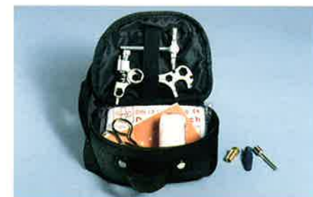
Werkzeugsatz. Unternehmen Sie keine Radtour ohne dieses nützliche Utensil. Das Werkzeug wird in einer genau auf die Laderaumseite angepassten Nylontasche verstaut und enthält ein Multifunktionswerkzeug, Pannen- und Erste-Hilfe-Set und 3 Ventiladapter für Fahrradreifen.

Das Bike Paket des Meriva beinhaltet eine komplette und qualitativ hochwertige Ausrüstung, die Ihren Fahrrad-Urlaub sicherer und komfortabler macht.