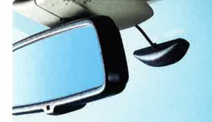
Voll integrierte Scheibenklebeantenne für verbesserten mobilen Telefonempfang.