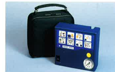
Kompressor. Anschluss an die 12-V-Zusatzsteckdose oder den Zigarettenanzünder. Mit Hilfe der Adapter können praktisch alle aufblasbaren Artikel aufgepumpt werden.