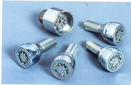
Satz Radsicherungen (4 Stück) für Leichtmetallräder.