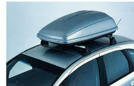
Travel Box, 350 l Fassungsvermögen, stabil, aber leichtgewichtig, staub- und wasserdicht (139 x 90,5 x 42 cm). Lackierbar in Karosseriefarbe.