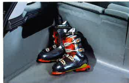
Flexible Laderaummatte, robust und leicht zu reinigen.