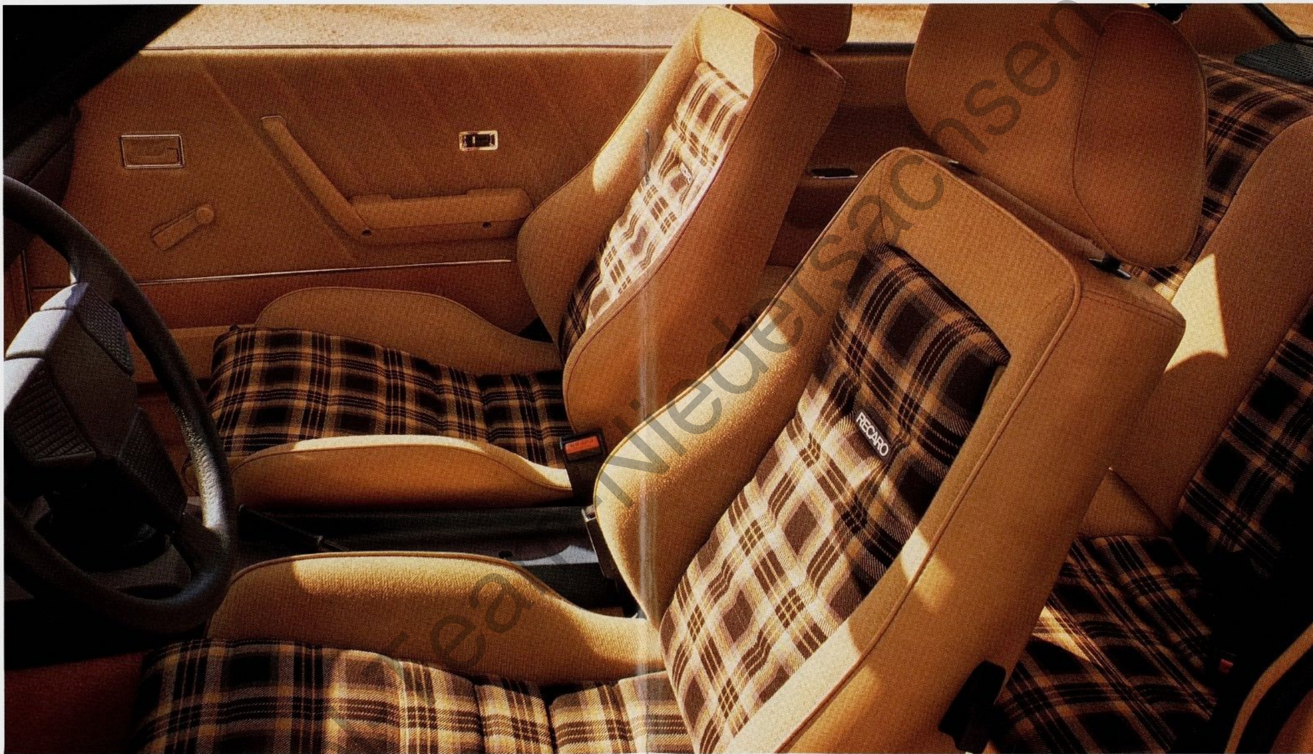
Abb. Innenraum Manta GT/E

Der neue Manta. Sportlich auf der ganzen Linie.