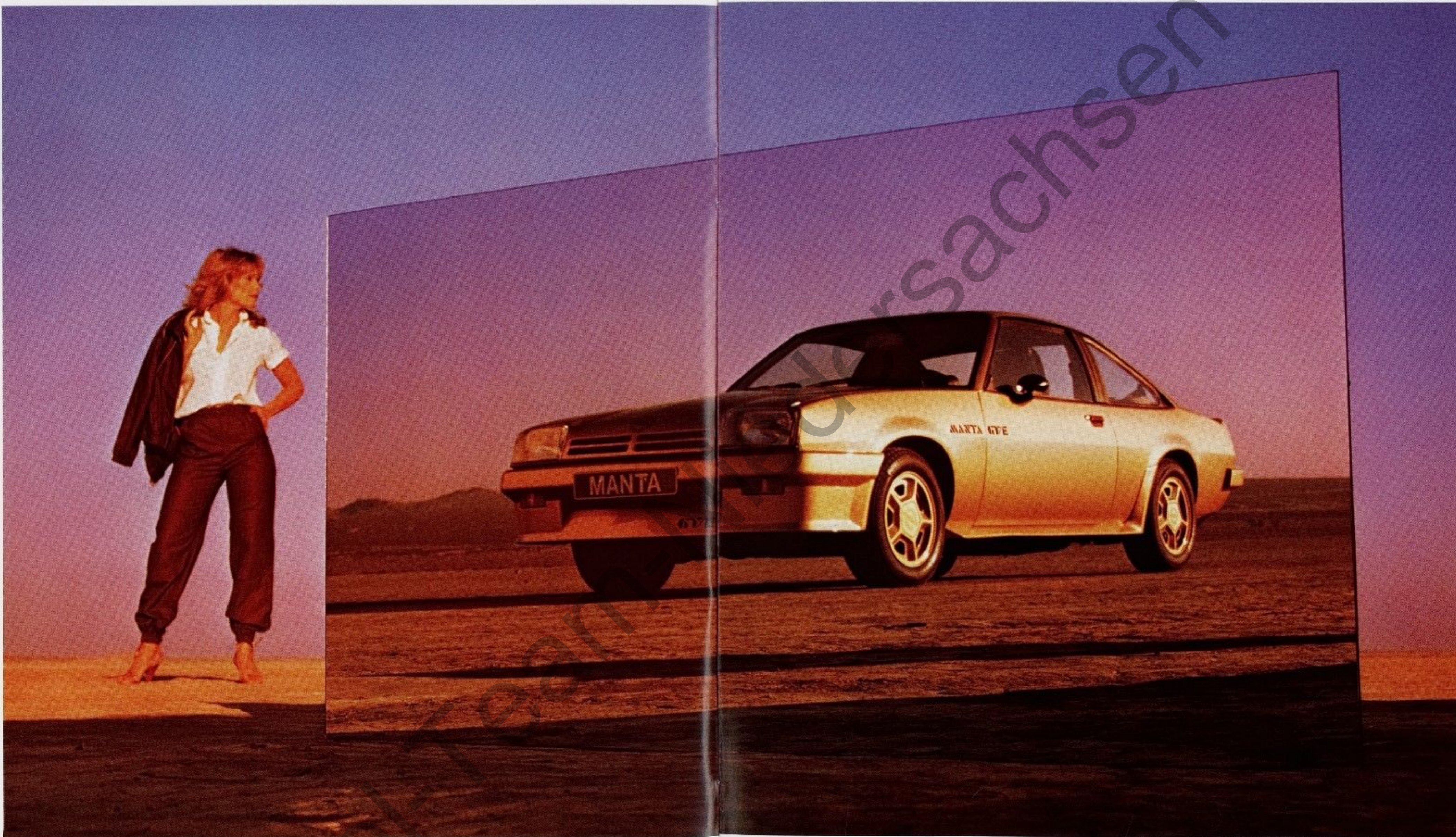
Abb. Manta GT/E. Zweischicht-Metallic-Lackierung ist Sonderausstattung.

Männlich, stark, sportlich – das ist der neue Manta. Das Automobil für begeisterte Fahrer. Moderne, leistungsstarke Motoren mit günstigen Verbrauchswerten; das Sportfahr-