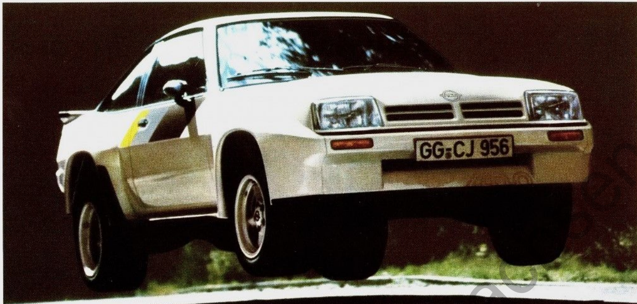
Abb. Manta 400. Umbausatz Karosserie, Leichtmetallfelgen 8J x 15 und Stahlgürtelreifen 225/50 VR 15 sowie Radio gegen Mehrpreis.