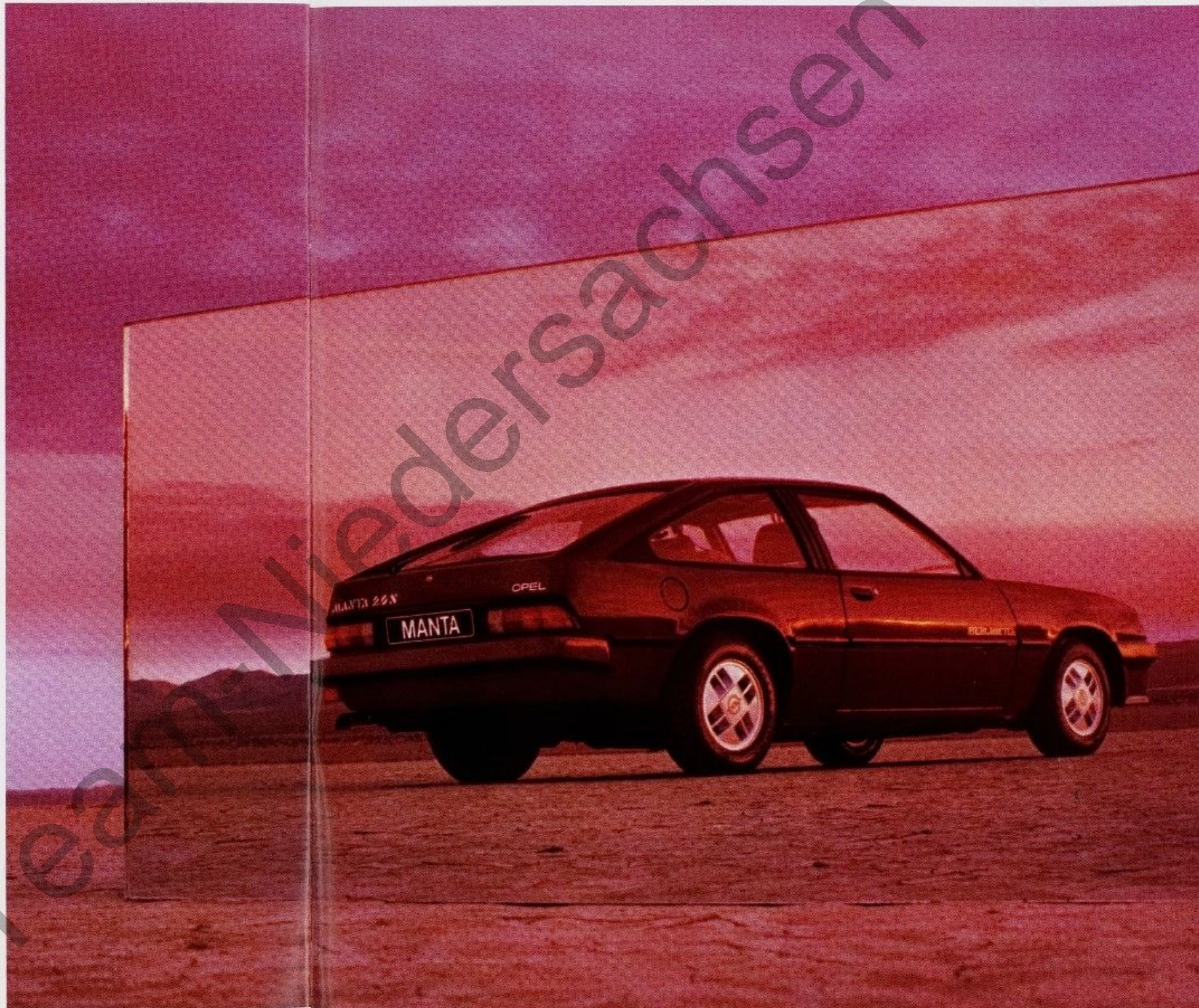
Abb.: Manta CC Berlinetta. Zweischicht-Metallic-Lackierung und Radio sind Sonderausstattung.

Manta GT/J: Stahlgürtelreifen 185/70 R 13 84 S auf neugestalteten Felgen 5 1/2 J x 13. Spezielle Vorder- und Hinterfedern, sportlich abgestimmte Stoßdämpfer und verstärkter Stabilisator hinten. Sportaußenspiegel. 3-Speichen-Sportlenkrad.