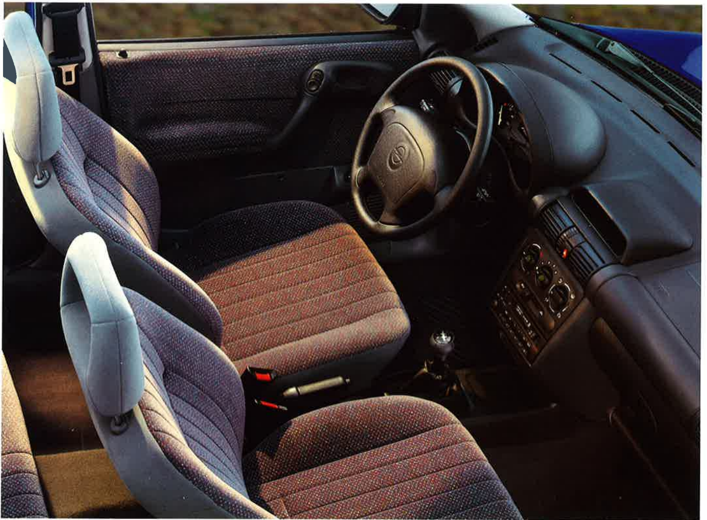
Elektrische Fensterheber und elektrisch einstellbare und beheizbare Außenspiegel Sonderausstattung.

Was für den Sport gilt, trifft auch auf den Corsa Atlanta zu: Dabeisein ist alles. Also: Nicht zuschauen, sondern einsteigen! Wer dieses flotte Auto für sich entdeckt, wird belohnt mit viel Komfort und mit einer Atmosphäre von sportlicher Gelassenheit, die immer wieder motivierend wirkt. Auf kleineren ebenso wie auf größeren Touren.