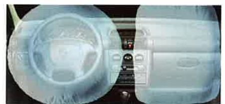
Opel Full Size Airbags. Serienmäßige Sicherheit für Fahrer und Beifahrer.