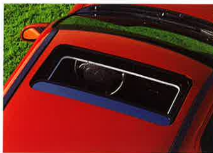
Der Fahrspaß ist nach oben offen. Das transparente Schiebe-/Hebedach gehört zur Serienausstattung des Corsa Atlanta.

Was für den Sport gilt, trifft auch auf den Corsa Atlanta zu: Dabeisein ist alles. Also: Nicht zuschauen, sondern einsteigen! Wer dieses flotte Auto für sich entdeckt, wird belohnt mit viel Komfort und mit einer Atmosphäre von sportlicher Gelassenheit, die immer wieder motivierend wirkt. Auf kleineren ebenso wie auf größeren Touren.